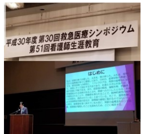
市民福祉常任委員として、熊谷市医師会主催のシンポジウムに出席