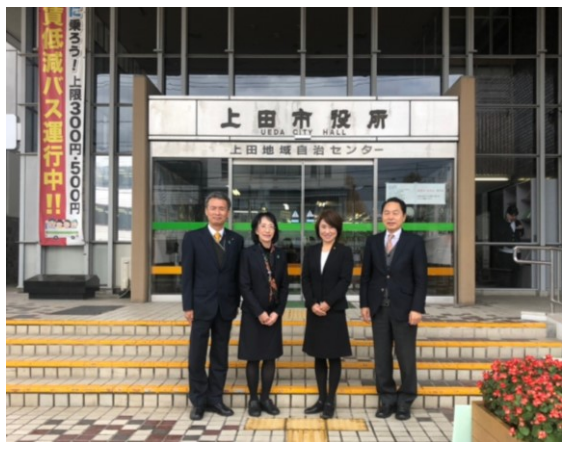
市議会 公明党行政視察で上田市へ